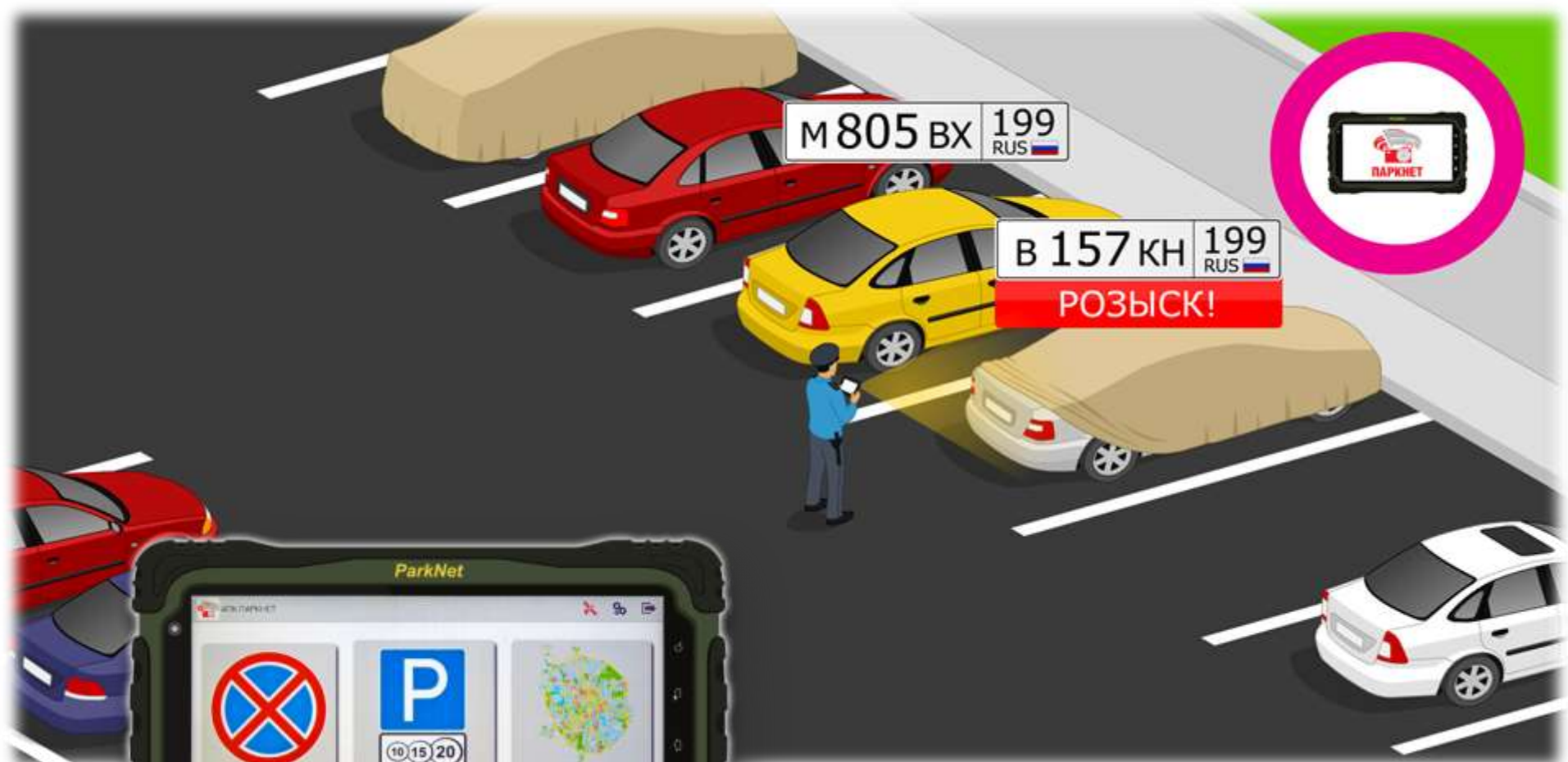
Внешний вид и главное меню фотофиксатора ПаркНет

Портативный комплекс ПаркНет основные операции проводит в автоматическом режиме: