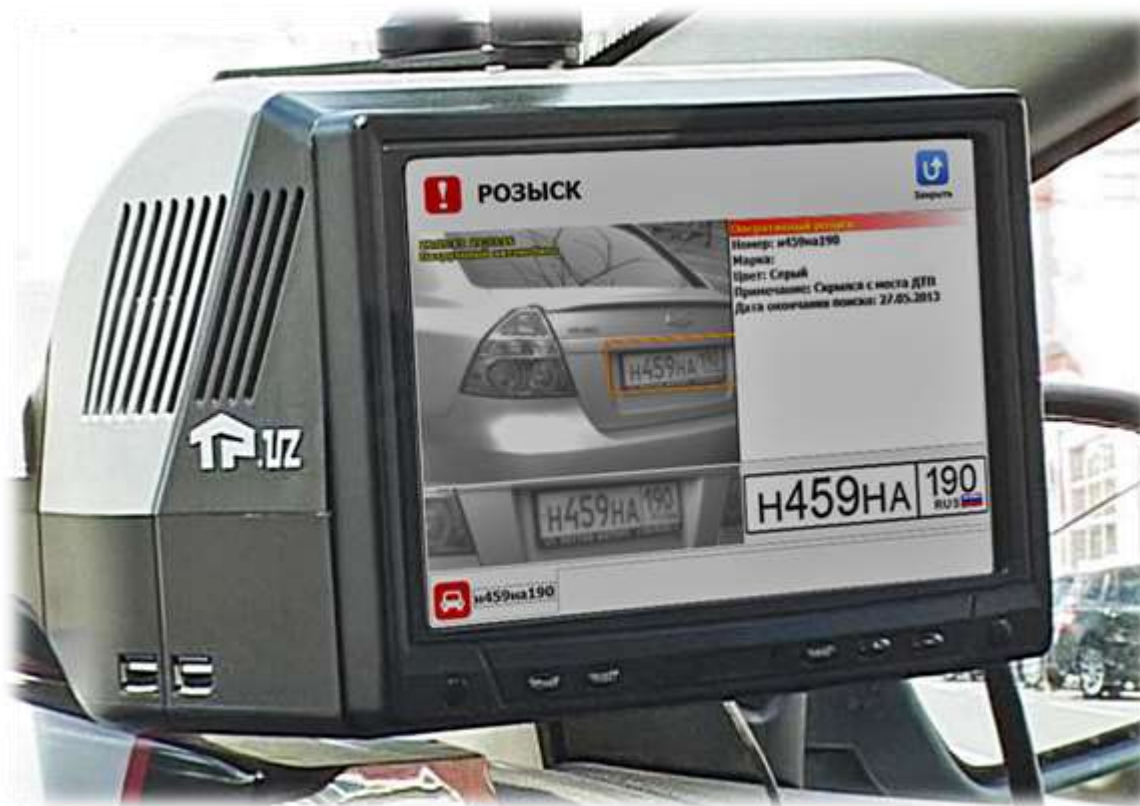
Интерфейс «сработки розыска» на экране комплекса ПаркРайт установленного внутри патрульного автомобиля

Комплекс ПаркРайт автоматически проверяет все автомобили, попавшие в зону видимости камер, по подключенным базам розыска. При выявлении разыскиваемого автомобиля оператору выводится визуальное и звуковое оповещение об обнаружении.