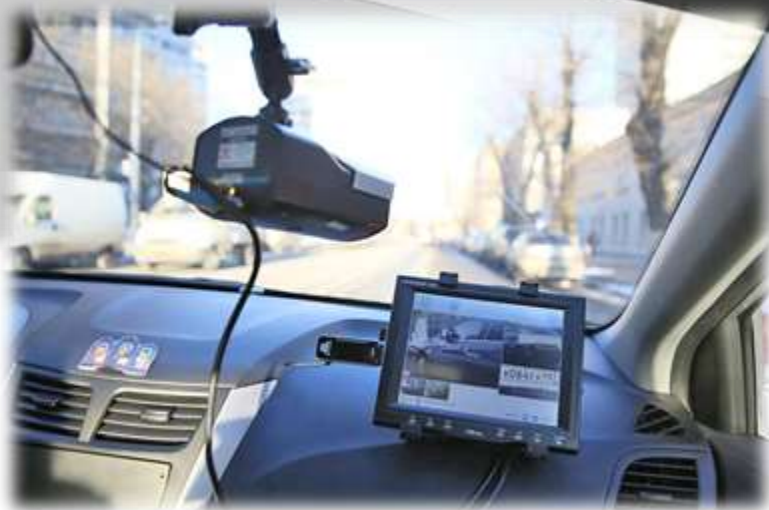
Комплекс ПаркРайт установленный внутри патрульного автомобиля

Комплекс ПаркРайт работает по базе розыска, которая подключена и размещается «на борту». При этом база розыска актуализируется в режиме реального времени с удаленного сервера.