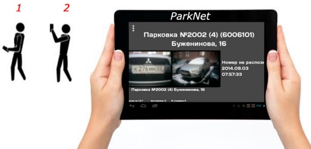
Рисунок 2.3 – Положения Фотофиксатора для фотографирования

В автоматическом режиме управление функциями Комплекса осуществляется изменением пространственной ориентации Фотофиксатора. Внутри Фотофиксатора установлен акселерометр, который отслеживает его пространственное положение и автоматически включает функцию фотографирования.