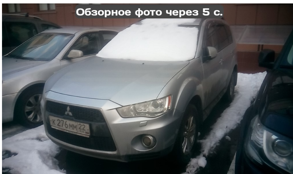
Рисунок 2.6 – Экран фотографирования обзорного фото

Когда таймер дойдет до 2-х секунд и менее, он будет сопровождаться звуковой индикацией. После фотографирования ГРЗ Комплекс автоматически перейдет к фотографированию обзорного фото.