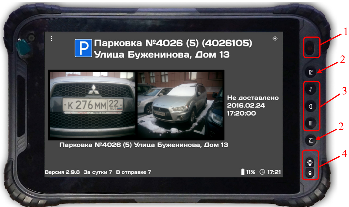
Рисунок 1.1 – Фотофиксатор (вид спереди)