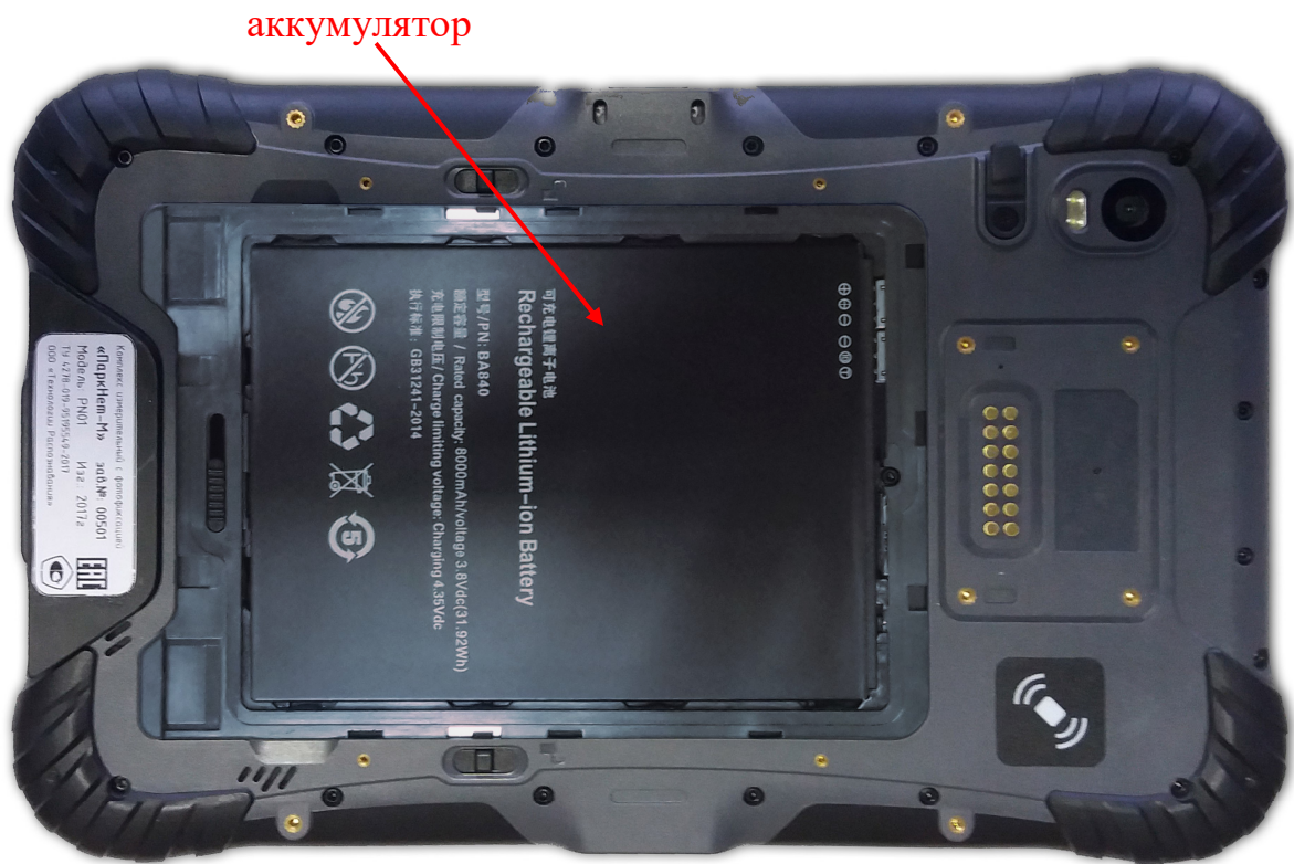
Рисунок 1.3 – Фотофиксатор (вид сзади, открыт аккумуляторный отсек)