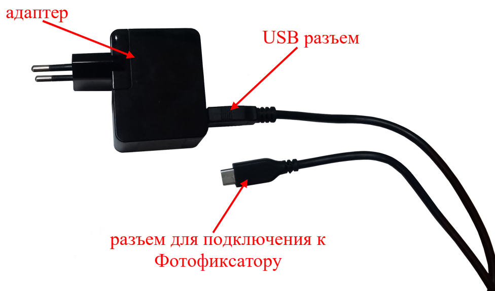
Рисунок 1.5 – Зарядное устройство с USB кабелем