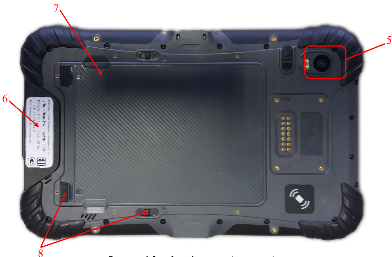
Рисунок 1.2 – Фотофиксатор (вид сзади)

Крышка отсека для аккумулятора снимается, если нажать на рычажки (8).