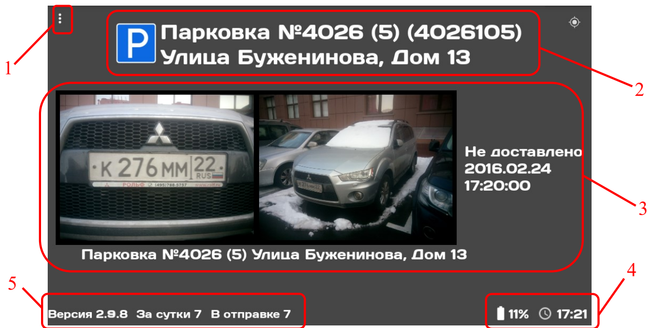
Рисунок 2.1 – Главный экран