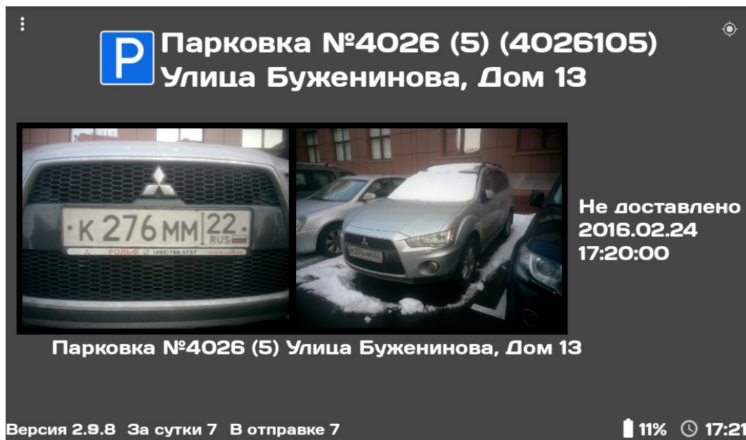
Рисунок 2.4 – Главный экран в режиме просмотра

В режиме просмотра (положение 1, Рисунок 2.3) экран Фотофиксатора включается (Рисунок 2.4).