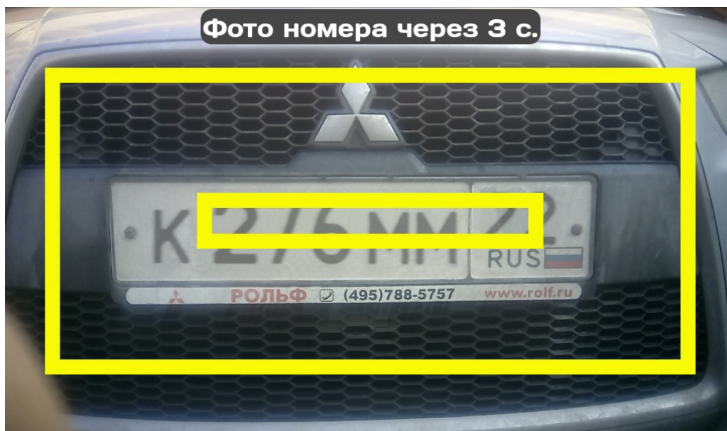
Рисунок 2.5 – Экран фотографирования ГРЗ

Для фотографирования ГРЗ необходимо разместить в кадре Фотофиксатора согласно рисунку 2.5.