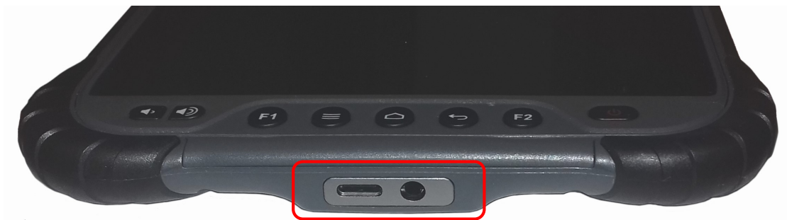
Рисунок 1.4 – Фотофиксатор (вид справа, разъем для подключения зарядного устройства)